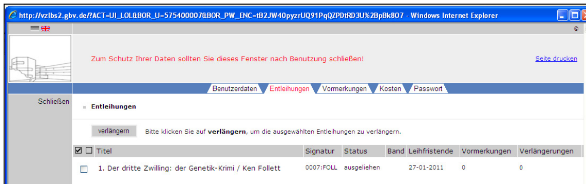
Abbildung 3 Ansicht der Entleihungen im Benutzerkonto

Im Benutzerkonto können die entliehenen Medien unter der Registerkarte „Entleihungen“ angesehen und verlängert werden.