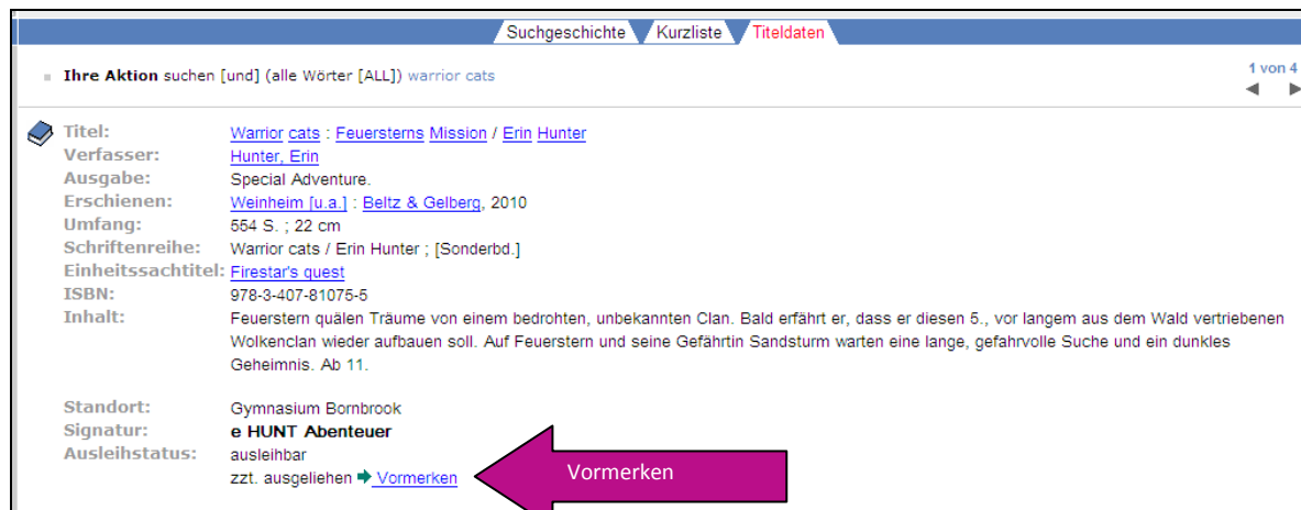
Abbildung 1 Detailanzeige eines ausgeliehenen Titels

Detailanzeige des gewünschten Mediums aufrufen und auf „ Vormerken “ klicken.